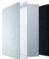
Vorfilter » HEPA Filter » Aktivkohlefilter

Phase 3: letztendlich absorbiert der Aktivkohlefilter unangenehme Gerüche, wie zum Beispiel von Zigaretten und Zigarren.