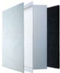
Vorfilter » HEPA Filter » Aktivkohlefilter

Phase 3: letztendlich absorbiert der Aktivkohlefilter unangenehme Gerüche, wie zum Beispiel von Zigaretten und Zigarren.